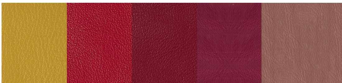
PR20 Giallo - Yellow - Jaune - Gelb - Amarillo - Желтый