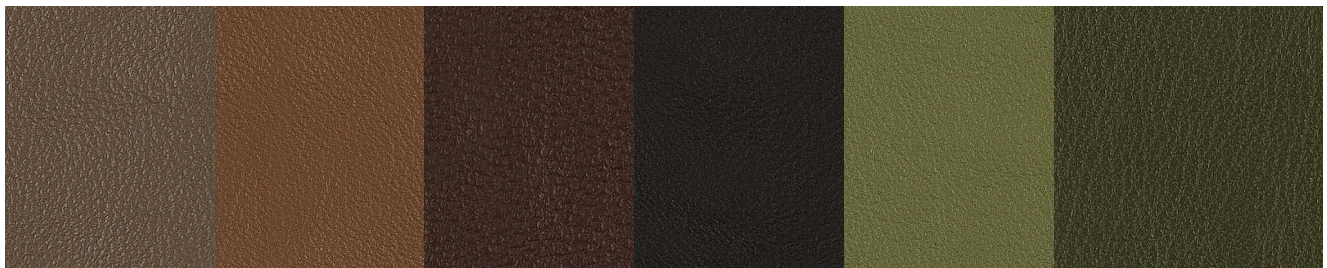
PR14 Fango - Mud - Vase - Schlamm - Barro - Серо-Бежевый