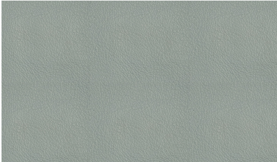
PR06 Verde chiaro - Light green - Vert clair - Leicht grün - Verde claro - Светло-Зеленый