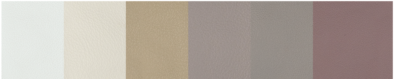
PR01 Bianco - White - Blanc - Weiß - Blanco - Белый